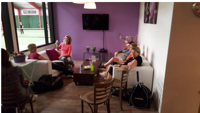
Ach ja, tennis kijken is wel leuk, maar een beetje bijkletsen toch ook?

Zelfs Roger Federer mengde zich enkele weken geleden in deze discussie. De internationale tennisbond ITF, de mannenbond ATP, de vrouwenbond WTA en het Grand Slam Board besloten daarop een commissie op de zaak te zetten. Het mondiale onderzoek naar matchfixing gaat langer dan een jaar duren. Binnen de TV Buitenpost waren deze berichten aanleiding om undercover een eigen onderzoek te starten en deze Sanjesavond leende zich daar uitstekend voor. De ingrediënten voor matchfixing waren ruimschoots aanwezig. Maar liefst 4 getrouwde stellen hadden zich gemeld. Zouden de echtelieden elkaar helpen? Maar wat te doen als je tegen een van de twee kersverse ereleden moet spelen. Laat je die dan winnen? Of bitterballen verkwanselen voor het kopen van een winstpartij. Zoals te verwachten viel is de integriteit binnen de TV Buitenpost 100%. Geen enkele uitslag of signaal wees richting matchfixing. Via de KNLTB zal de TV Buitenpost de mondiale instanties informeren over deze uitkomst.