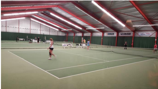
Die bal was toch uit?